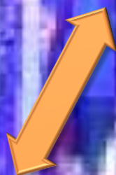
Immagine e somiglianza